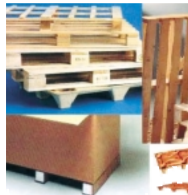
Imballaggi pallettizzati e pallet