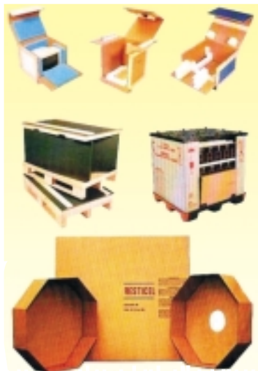
Progettazione di imballaggi speciali