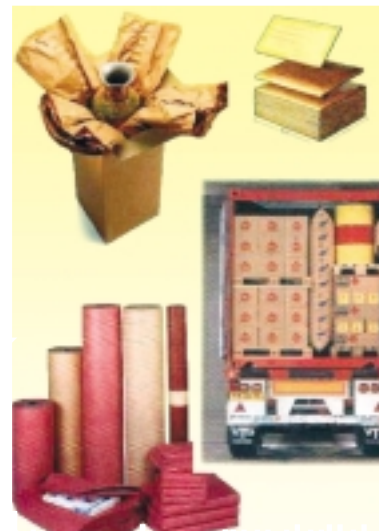
Riempimento imballi, distanziatori