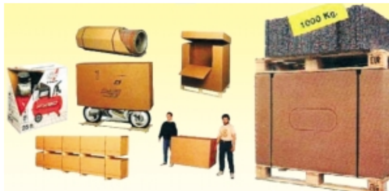
Imballaggi in cartone ondulato. Soluzioni speciali per imballare qualsiasi prodotto