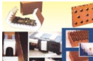
Imballaggi su misura per qualsiasi articolo